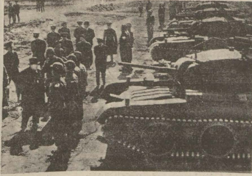
Çörçil, Amerika genel kurmay başkanı General Marşal ile (solda) motörize bir kit'ayı teftiş ederlerken

Stokholm, 8 (A.A.) — Havas ajansının hususî muhabiri bildiriyor: Kotelnikof ile Volga nehri arasındaki bozkırlarda iki gündüzbir büyük bir tank ve piyade muharebesi cereyan etmektedir. Rus kuvvetleri yeniden geri çekilmek zorunda kalmışlardır. Bu muharebeye dair gelen haberlerde Sov. (Devamı 5 inci sayfa)